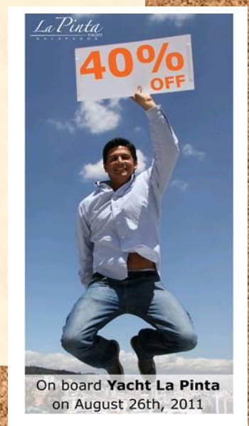
On board Yacht La Pinta on August 26th, 2011

Auch weitere Daten in der zweiten Septemberwoche sind vergünstigt – Sprechen Sie uns an!