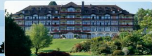
Hôtel Ermitage und Hôtel Royal