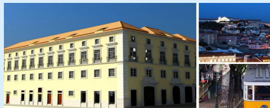
CS Palace Bairro Alto Eröffnung 2012