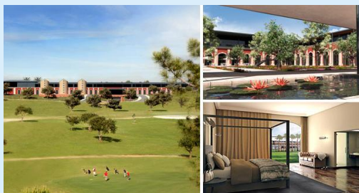
CS Algarve Palace Hotel Eröffnung Sommer 2011