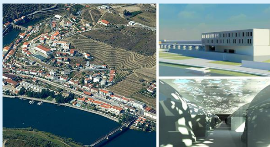
CS Cubas Douro Hotel Eröffnung 2012