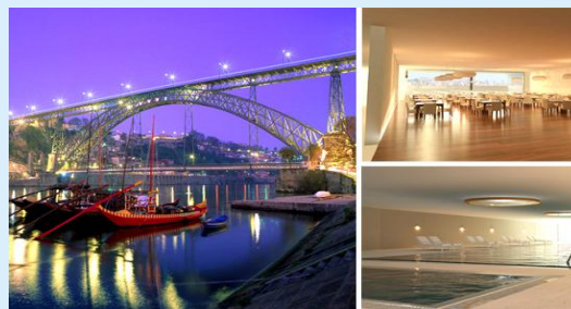
CS Vintage Oporto Hotel Eröffnung 2012