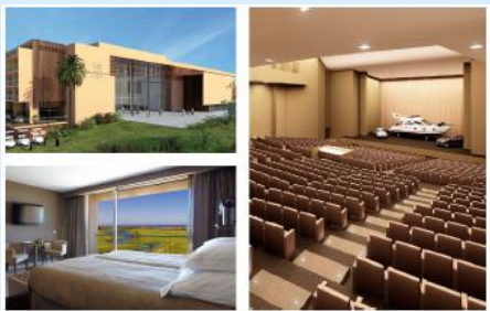
CS Salgados Golf & Beach Hotel Eröffnung im Frühjahr 2011