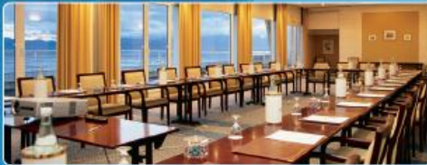
In Tageslicht gehüllte Salons