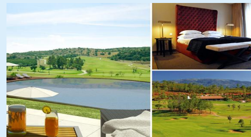
CS Morgado Golf Hotel Eröffnet im März 2011