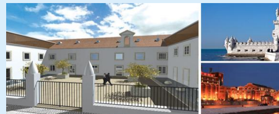
CS Palace Lisboa Hotel Eröffnung Sommer 2011