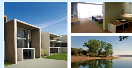
CS Hotel do Lago Montargil Eröffnet im März 2011