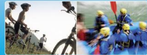
Verschiedene Aktivitäten mitten in den französisch-schweizerischen Alpen

Hier haben Ihre Wachstumperspektiven gute Aussichten